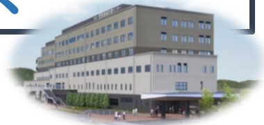
市立野洲地域医療センター 令和9年3月開院