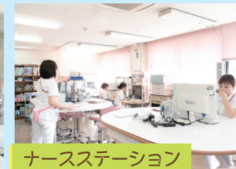
ナースステーション